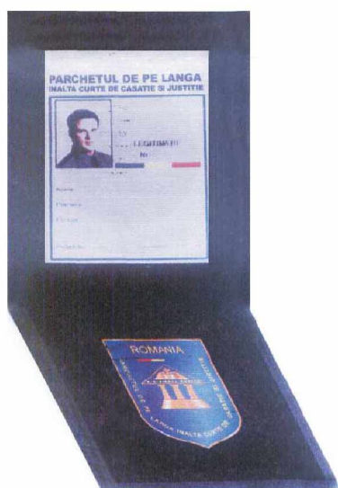
Legitimatie de serviciu